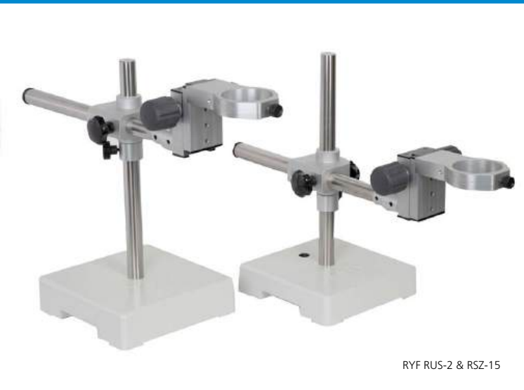
RYF RUS-2 & RSZ-15

Lorsque cela s'avère judicieux, Ryf SA rapatrie la production en Europe et fabrique à nouveau certaines pièces et modules en Suisse.