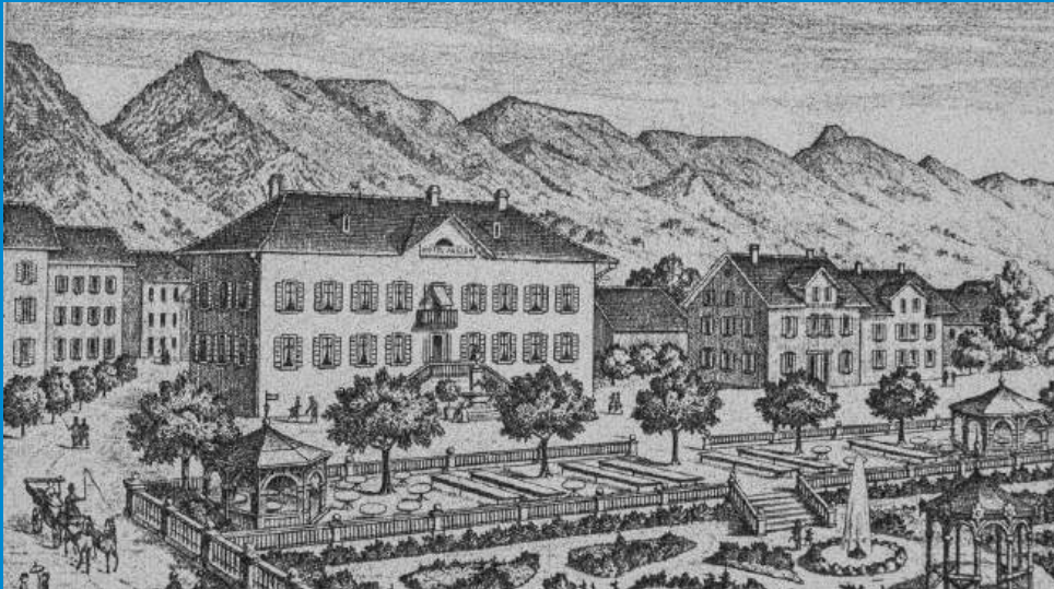
Der grosse Garten (heute Solothurnstrasse) wurde etwas gar grosszügig dargestellt ...