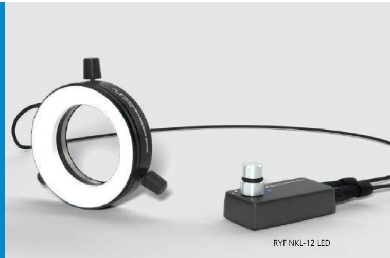
RYF NKL-12 LED

Toujours demandés dans le nouveau millénaire : les développements propres de Ryf SA, entre autres dans le domaine de l'éclairage.