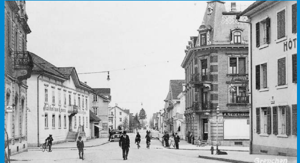
Die Realität mit Blick auf die Solothurnstrasse zu Beginn der Motorisierung.