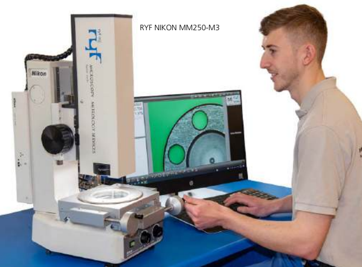
RYF NIKON MM250-M3

On est toujours une PME, mais l'orientation est claire : développer la position sur le marché dans les domaines de la microscopie, des systèmes de métrologie et d'imagerie. Outre l'industrie horlogère, de plus en plus d'entreprises micromécaniques, d'entreprises de fabrication de la technique médicale et d'organisations des domaines de la recherche et de la formation font confiance aux produits et aux prestations de Ryf SA. Le service complet devient une marque de fabrique, 10 techniciens travaillent dans ce domaine. En 2007, la présence en Suisse romande est renforcée avec la filiale de Commugny. La même année, introduction de l'ERP/SAP pour les quelques 20'000 articles. L'obtention de la représentation Suisse Nikon Metrology / Instruments et la certification ISO 9001 (IQNet-Certified) sont d'autres étapes importantes de cette phase de croissance intensive. En 2015, l'entreprise fête son 50e anniversaire.