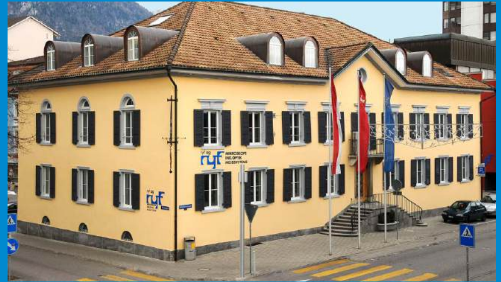
Das Löwen-Haus vor und nach der umfassenden Sanierung. | La maison « Löwen » avant et après sa rénovation complète.