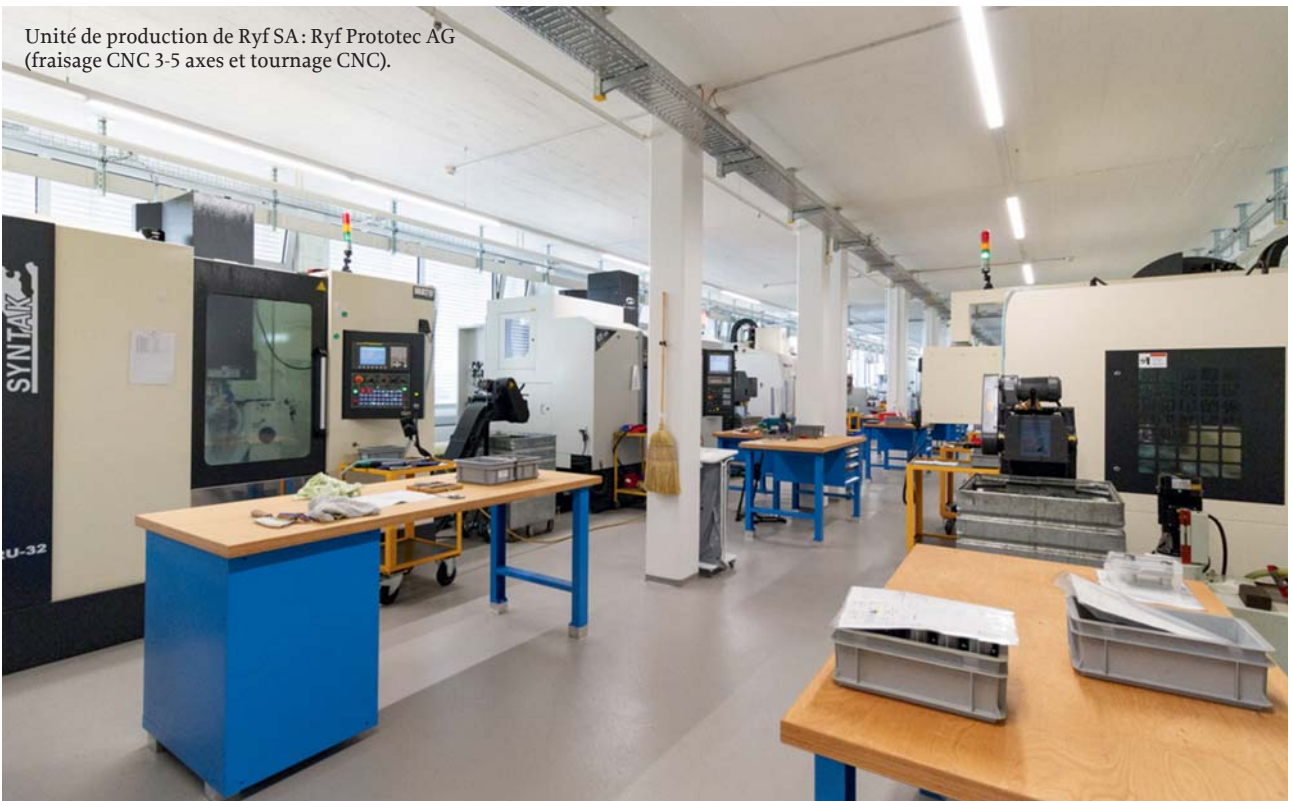
Unité de production de Ryf SA: Ryf Prototec AG (fraisage CNC 3-5 axes et tournage CNC).

romande. 2009 voit l'extension de la palette des prestations pour la maintenance et les réparations tandis qu'en 2011, la gamme de machines de mesures tridimensionnelles de Nikon Metrology s'étoffe. Devant l'étendue et la qualité des services proposées, Ryf SA est certifiée ISO 9001 en 2015. Pendant toutes ces années, l'entreprise n'a donc cessé de croître et s'est hissée à la pointe du marché dans le secteur des microscopes et des systèmes de mesure. Avec pour devise, «la meilleure solution pour vous», elle pense et agit de façon indépendante en privilégiant les solutions à long terme. Depuis cette année, elle est également présente à Zurich où elle a ouvert une nouvelle succursale dotée d'une salle de démonstration.