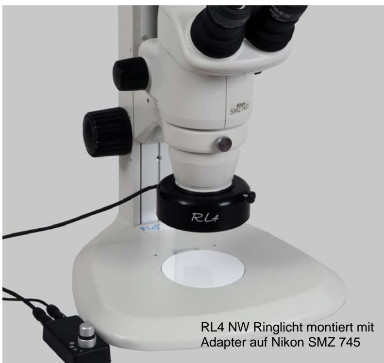
RL4 NW Ringlicht montiert mit Adapter auf Nikon SMZ 745