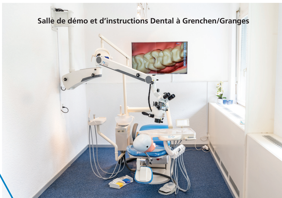
Salle de démo et d'instructions Dental à Grenchen/Granges

Le très grand champ de vision et le réglage précis du Variofocus (200 - 300mm) permettent une utilisation très confortable et ergonomique. Les poignées latérales ergonomiques dotées de boutons poussoirs permettent un contrôle facile de l'appareil photo. Le logiciel peut être utilisé directement au moyen de la souris (pas besoin de PC).