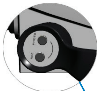
Boutton de poignée