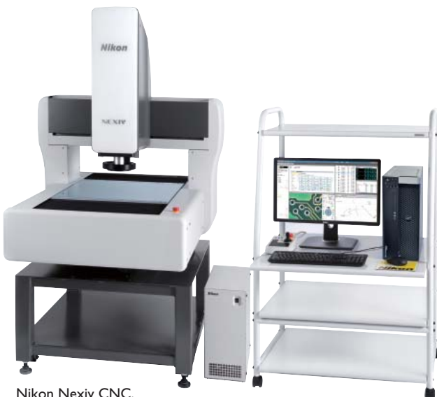
Nikon Nexiv CNC.

Grâce à ses propres développements et aux marques mondialement connues qui sont représentées chez Ryf SA, tout comme une vaste palette de produits, la société est un interlocuteur de choix pour répondre aux demandes spécifiques et ce, pour de nombreux secteurs d'activité. Devant la diversité des besoins, rien de mieux que d'expérimenter les appareils et être conseillé au plus juste avant de les acquérir. Attachée à proposer des services d'une qualité optimale, Ryf SA offre une prestation unique en Suisse dans son showroom principal de Granges-Grenchen où plus de 100 instruments et systèmes de mesure de différents fabricants (Nikon, Zeiss et Leica) sont ainsi à tester. Chaque client peut se faire une idée d'ensemble de la diversité des matériels existants et procéder à des essais comparatifs pour choisir la meilleure solution. Durant cette visite, des techniciens et des technico-commerciaux les assistent pour répondre à toutes les questions et les aiguiller vers le choix le plus en phase avec leurs attentes. Chacun peut anticiper sa venue en transmettant ses pièces, ses plans ou encore ses fichiers afin qu'une étude préalable soit effectuée avant la visite. Depuis 2006, l'antenne de Commugny dispose également d'une salle de démonstration où sont présentés les principaux produits. Pour un appareil sur-mesure ou un matériel inscrit au catalogue, Ryf SA est à même de répondre à toutes les demandes et de trouver les solutions pour chaque cas spécifique.