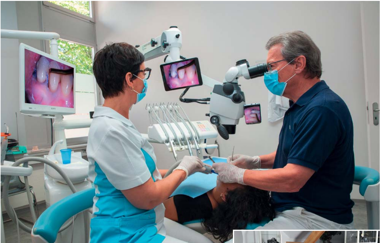
Ryeco AM-6000, zoom 8x.