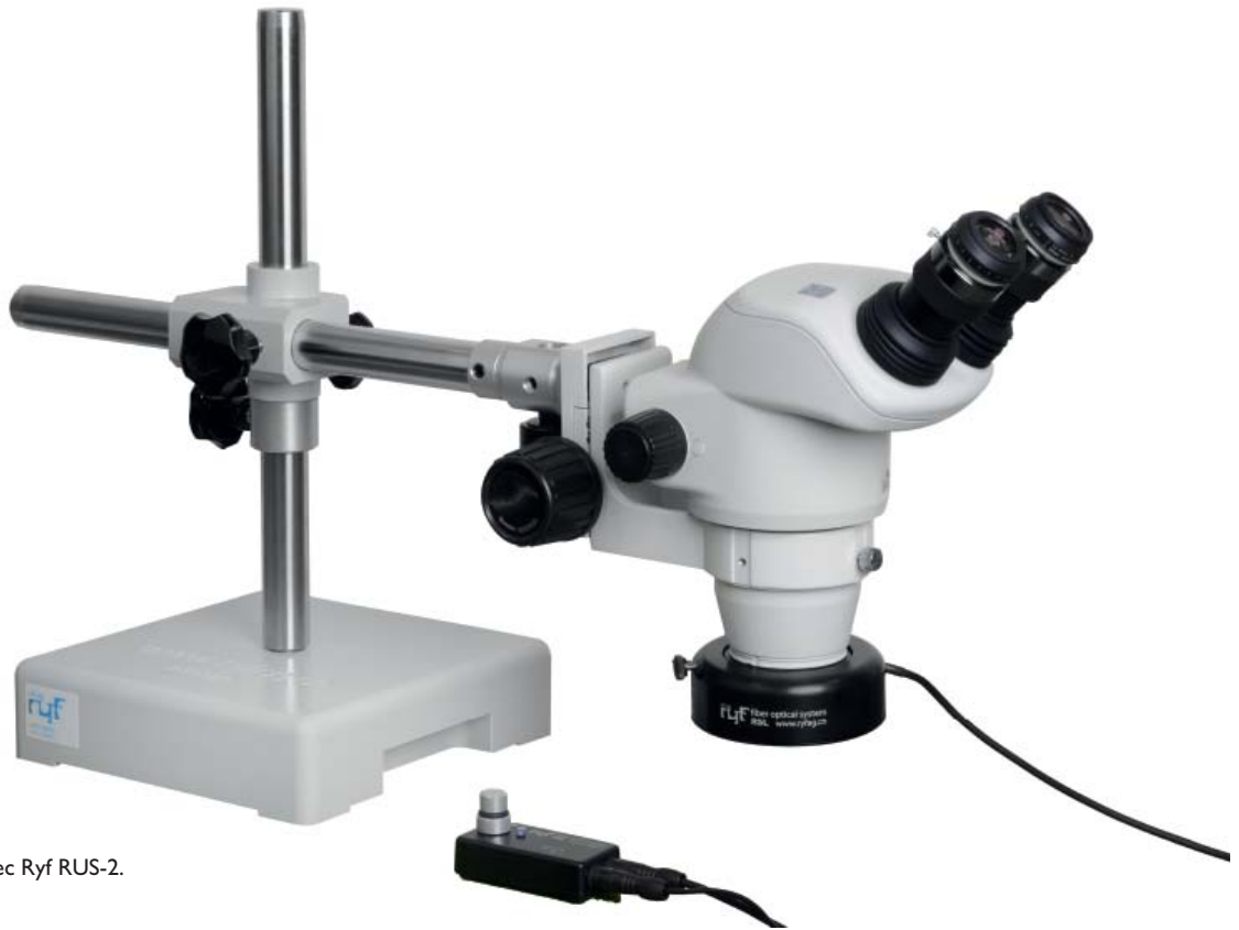
Nikon SMZ 745 avec Ryf RUS-2.