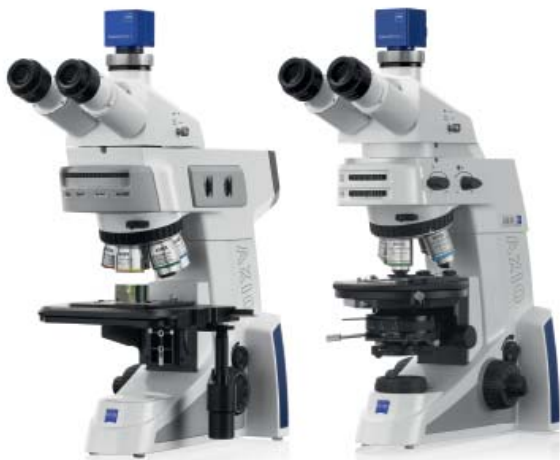
Axio Scope Zeiss.