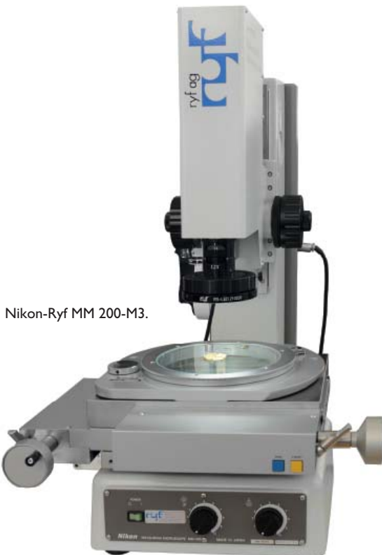
Nikon-Ryf MM 200-M3.