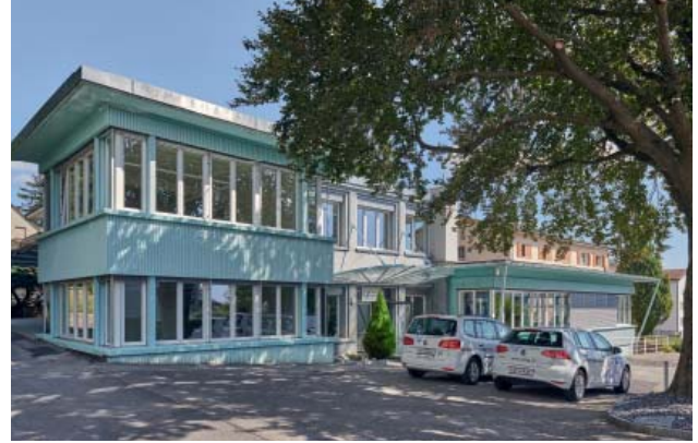
Atelier de réparation et centre d'usinage.