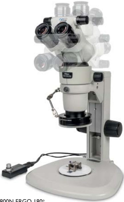
SMZ 800N ERGO 180°.

Aujourd'hui, avec une équipe de plus de 30 collaborateurs, dont 10 techniciens SAV pour toute la Suisse, pour certains présents depuis plus de vingt ans, Ryf SA est leader du marché. Chacun, dans des positions distinctes, est au service du client afin de le contenter pleinement. Pour la vente dans les showrooms ou directement chez le client, pour la création d'un appareil sur-mesure, où interviennent des ingénieurs et techniciens hautement qualifiés et réactifs, les points forts de la société sont nombreux à l'image des services uniques proposés en matière d'installation, de calibrage,